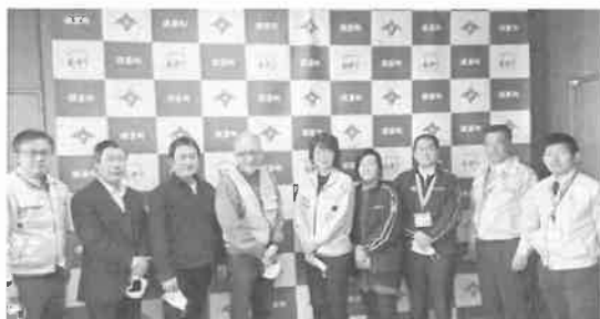
須恵町での連携促進ミーティング

その他にも様々な機会をとらえて、全国災害ボランティア支援団体ネットワーク(JVOAD)や、県内各地の様々な団体とのネットワーク構築に努めています。