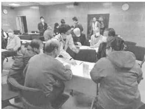
大牟田市での「風水害 24」ワークショップ

また、福岡市の中学校からメンバー二人に講師依頼をいただき、3年生の総合的な学習の時間に2クラスに分かれて「防災士」と「災害ボランティア」をテーマに話をさせていただく機会をいただきました。後日送っていただいた受講感想文を読ませていただくと、とても素直にたくさんのお話を吸収して、行動に移していこうという気になってくれた生徒さん達がたくさんいることが知れて、とても嬉しくなりました。