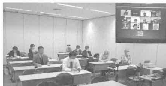
対面とオンラインのハイブリッド総会